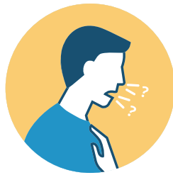
NUEVA PÉRDIDA DE SABOR O OLOR