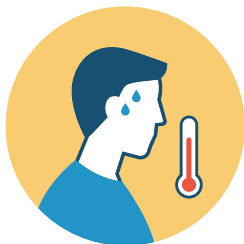
100.4* DE FIEBRE * *o la normas de la junta de la escuela si son menos