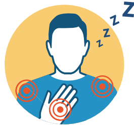
DOLOR MUSCULAR Y FATIGA