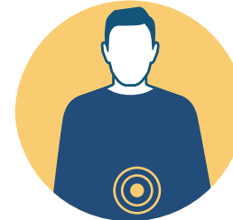
DIARREA, VÓMITOS O DOLOR ABDOMINAL