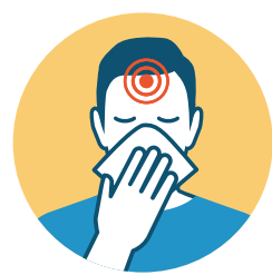
CONGESTIÓN Y FLUJO NASAL