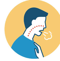
FALTA DE ALIENTO O DIFICULTAD PARA RESPIRAR